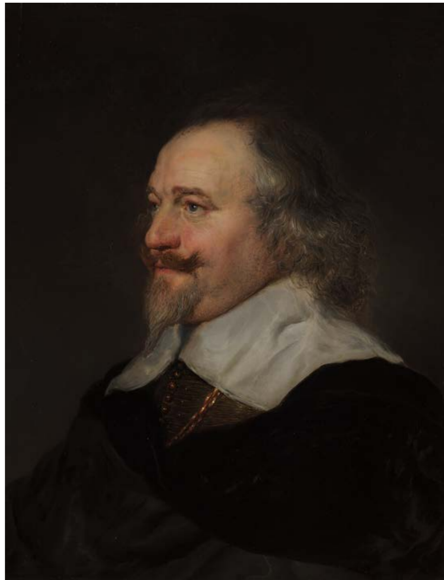
BRUIKLEEN JAN LIEVENS