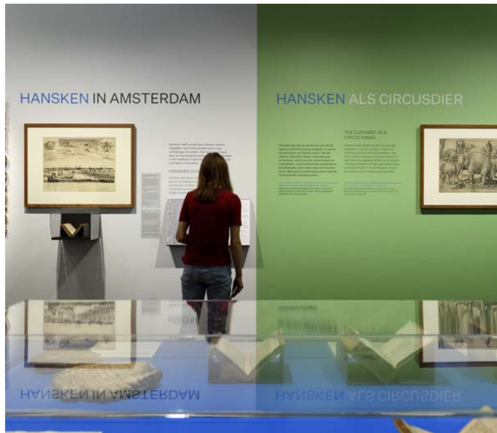
TENTOONSTELLING HANSKEN, REMBRANDTS OLIFANT.

De Vereniging Vrienden heeft ook dit jaar weer een substantiële financiële bijdrage aan Museum Het Rembrandthuis geleverd. In 2021 werd er een donatie van € 75.000 gedaan ten behoeve van de tentoonstelling Hallo Rembrandt! en de herinrichting van de binnenplaats in het kader van het Meesterplan fase 1.