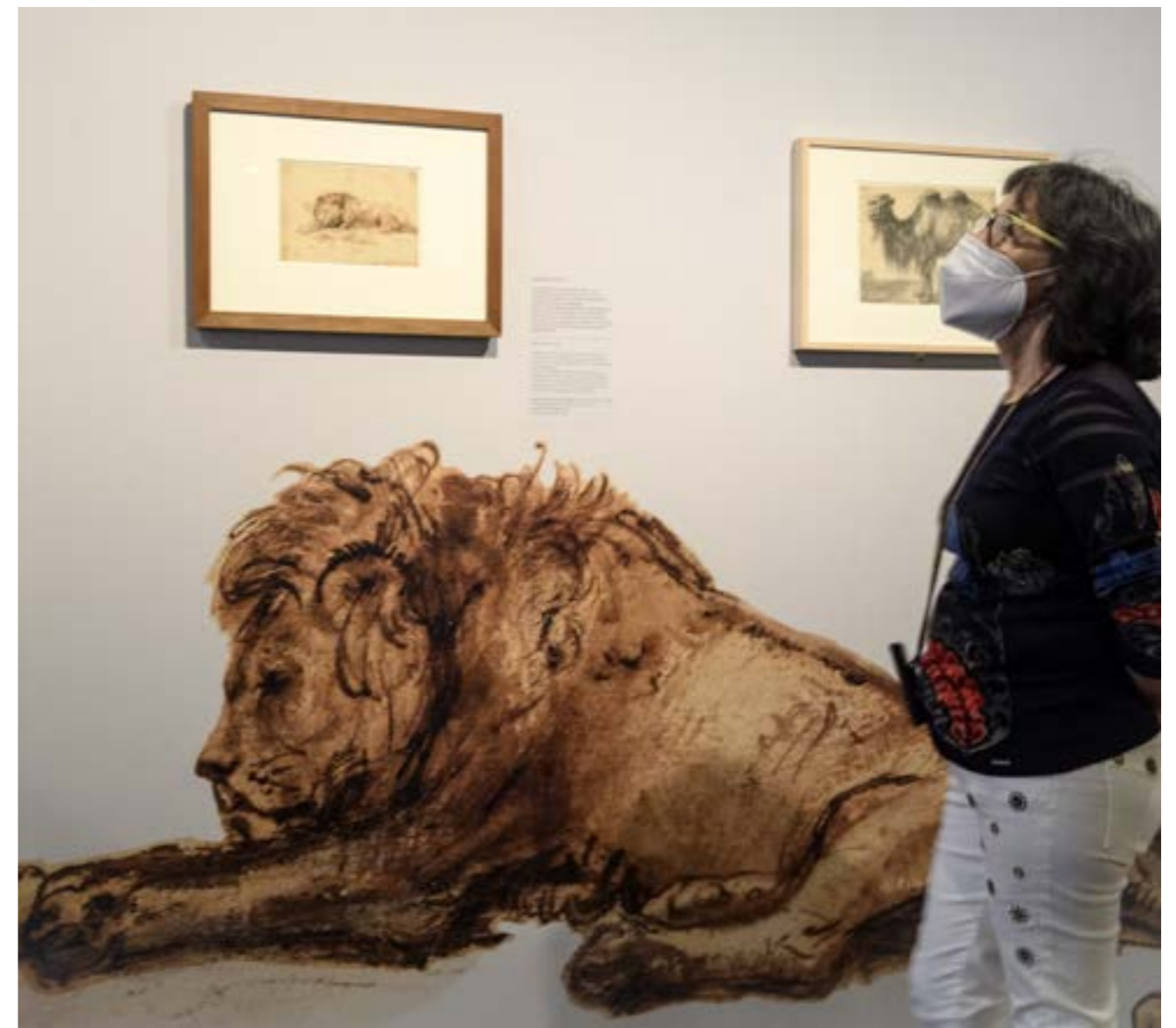
TENTOONSTELLING HANSKEN, REMBRANDTS OLIFANT.

We begonnen het jaar met een lockdown, die herhaaldelijk werd verlengd. Uiteindelijk konden de museumdeuren pas op 5 juni 2021 weer worden geopend. Wegens de langdurige lockdown, moesten we ons programma ingrijpend aanpassen; we hebben uiteindelijk twee tentoonstellingen kunnen programmeren ( Hansken, Rembrandts olifant en Hallo Rembrandt! ). Ook hebben we ons tijdens en na de lockdown extra ingezet op het gebied van online activiteiten. De geplande hedendaagse kunsttentoonstelling RAUW is verplaatst naar begin 2022.