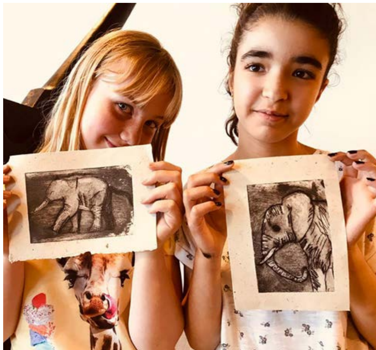
WORKSHOP KIJK! EEN OLIFANT!

Het verhaal van Hansken is inspirerend voor jong en oud. Speciaal voor kinderen van 6 tot 12 jaar organiseerden we de zomeractiviteit Kijk! Een olifant! Kinderen konden in de tentoonstelling een speurtocht met leuke opdrachten doen, gevolgd door een workshop; ze maakten een prent van een olifant, net als Rembrandt. De prent werd afgedrukt op papier gemaakt van olifantenpoep.