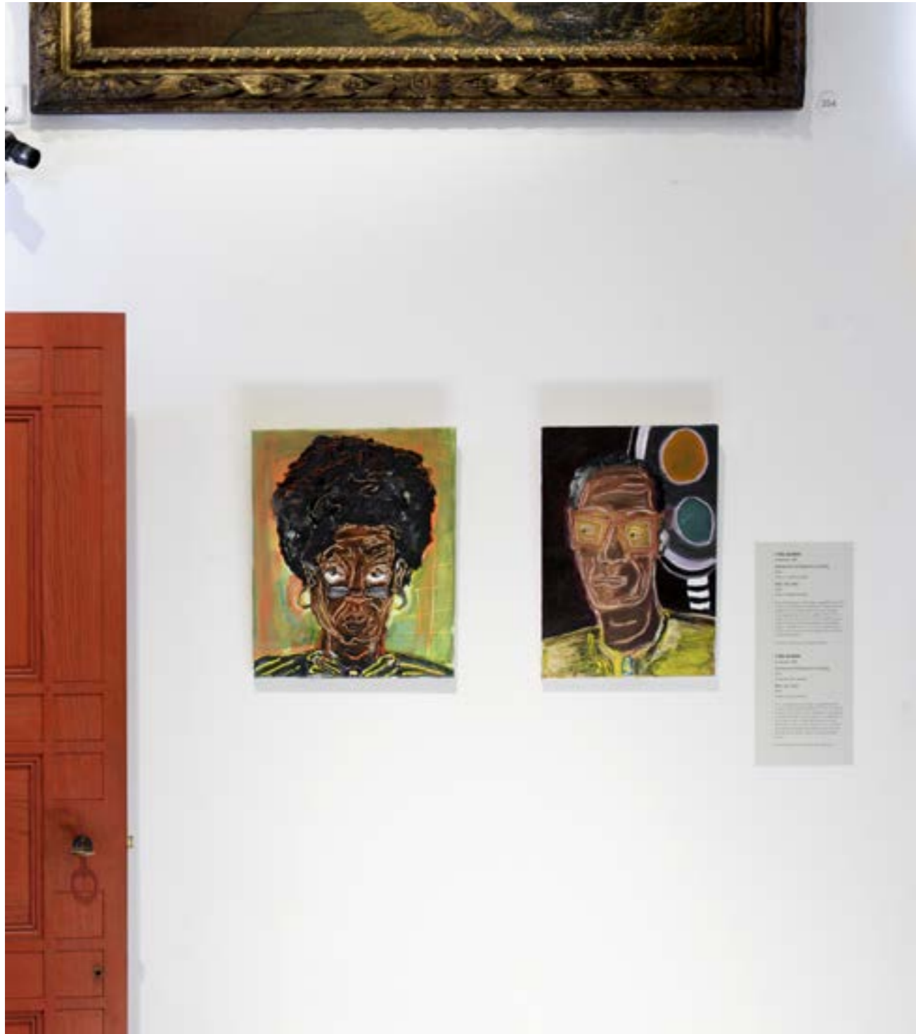
HEDEENDAAGSE KUNST VAN IRIÉE ZAMBLÉ IN DE SAEL.

kranten of tijdschriften vond. Het zijn details, maar ze roepen een hele wereld op. In 2020 hielden beide kunstenaars twee maanden lang atelier in Museum Het Rembrandthuis tijdens Rembrandt Open Studio. Ze maakten er werk over het thema 'ouderdom', waaronder de vier aankopen, die vanaf begin 2021 tussen de oude meesters in Rembrandts huis hangen.