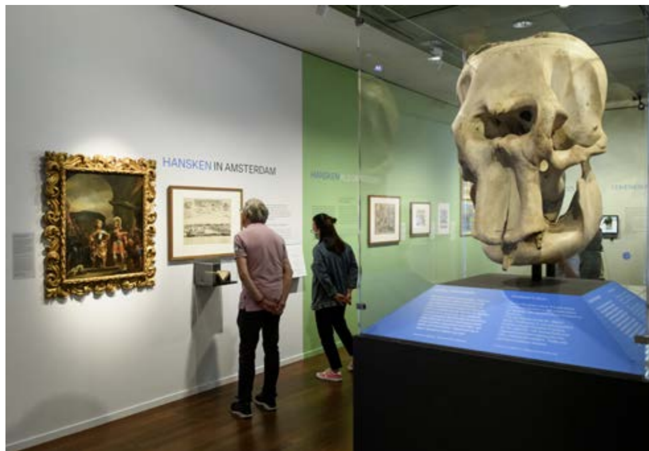
TENTOONSTELLING HANSKEN, REMBRANDTS OLIFANT.