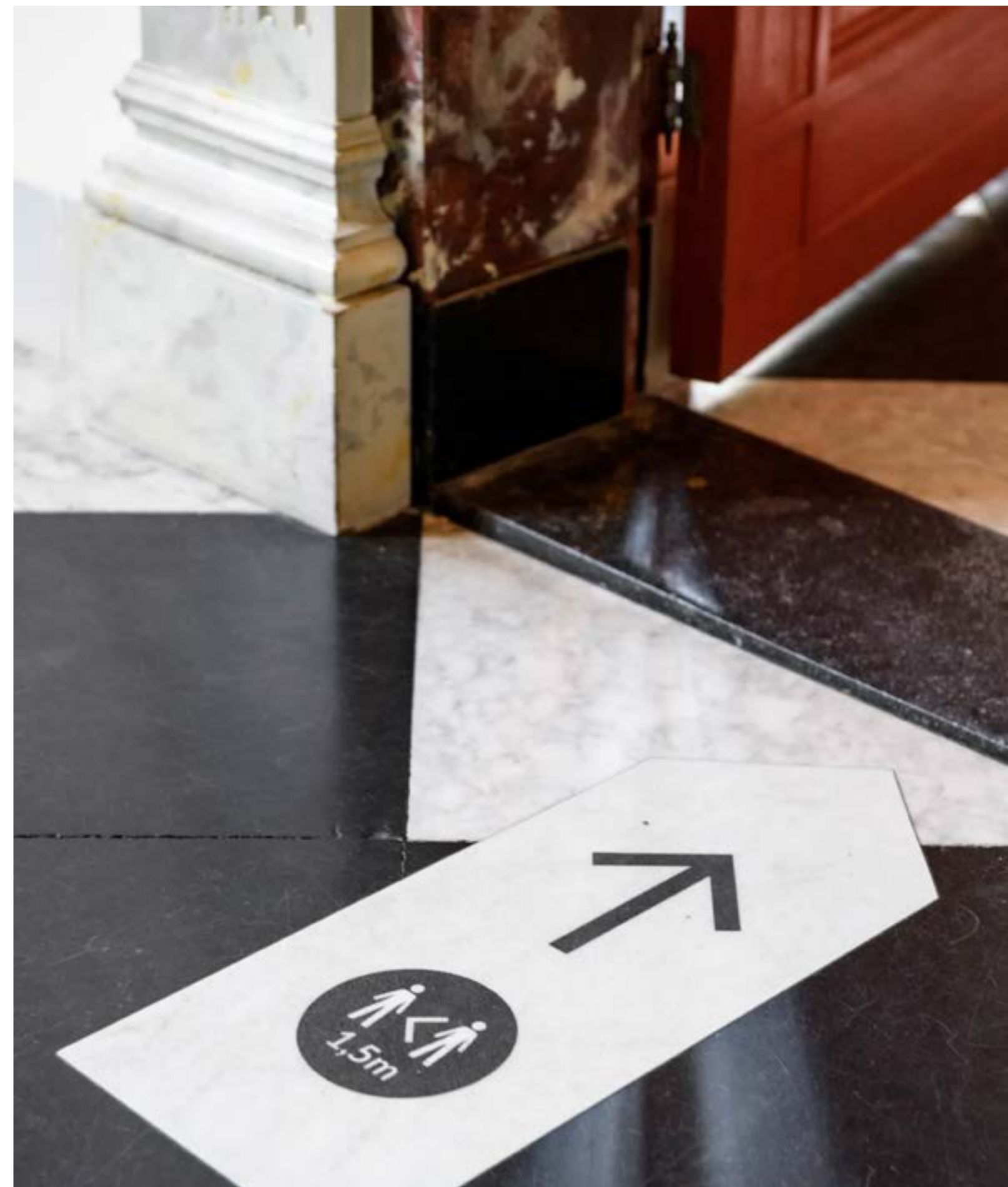
CORONAMAATREGELEN IN HET MUSEUM.