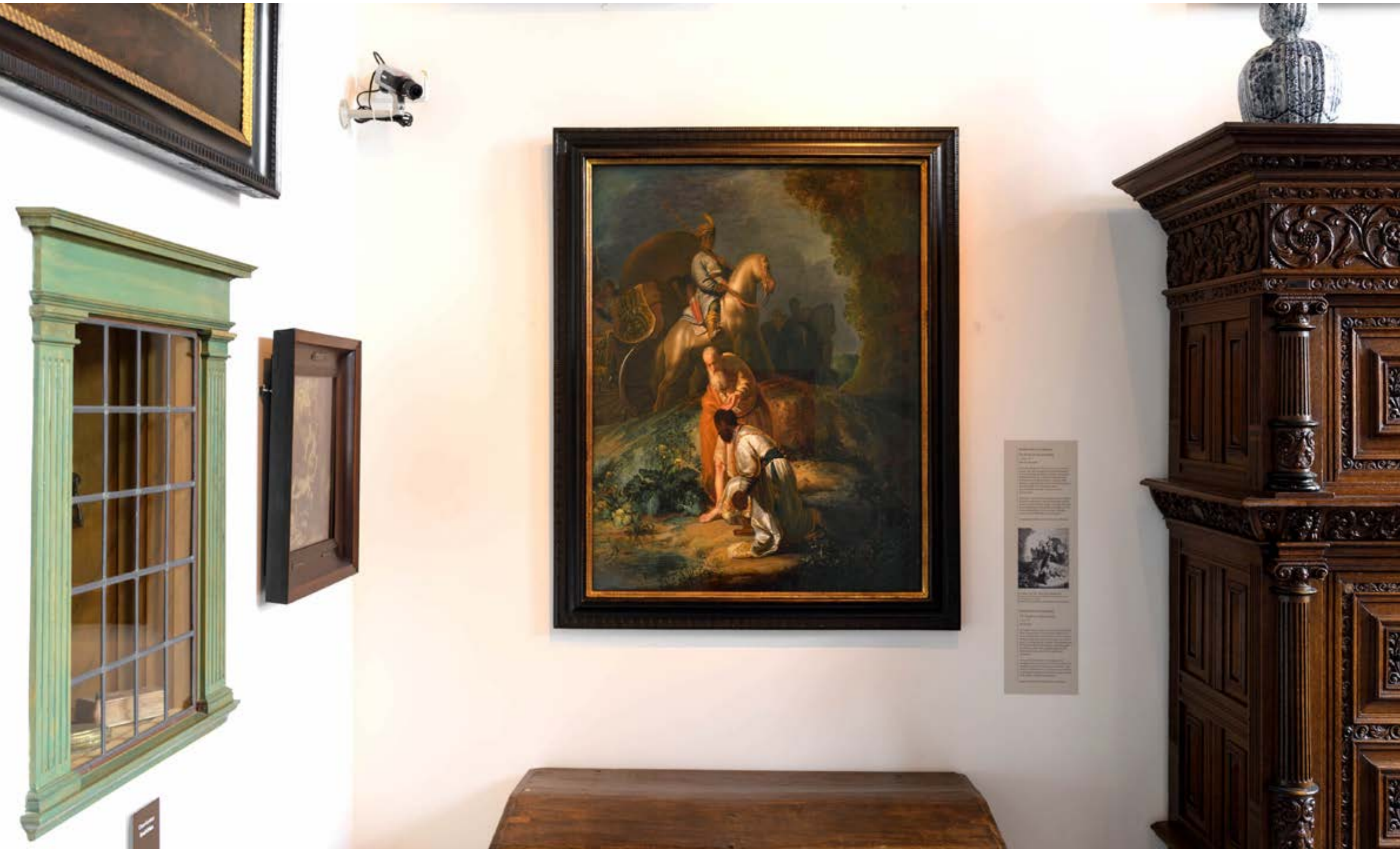
DE DOOP VAN DE KAMERLING IN HET VOORHUIS.