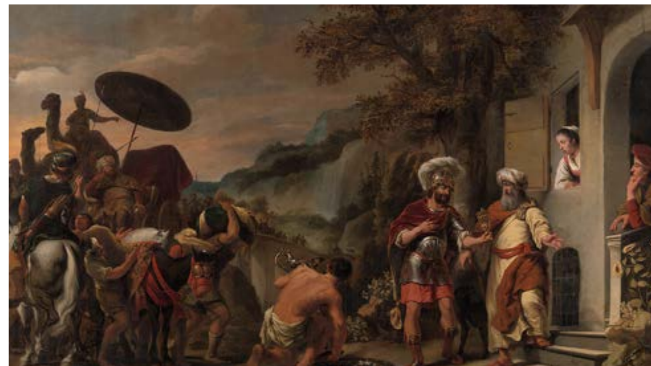
DE GERESTAUREERDE FERDINAND BOL

Op 17 september hebben we meegedaan aan de World Clean-up Day. Samen met mensen uit 180 landen hebben onze medewerkers de handen uit de mouwen gestoken voor de grootste wereldwijde opruimactie van het jaar. Door zwerfafval in onze eigen buurt op te ruimen hebben we een klein steentje kunnen bijdragen aan een schonere planeet.