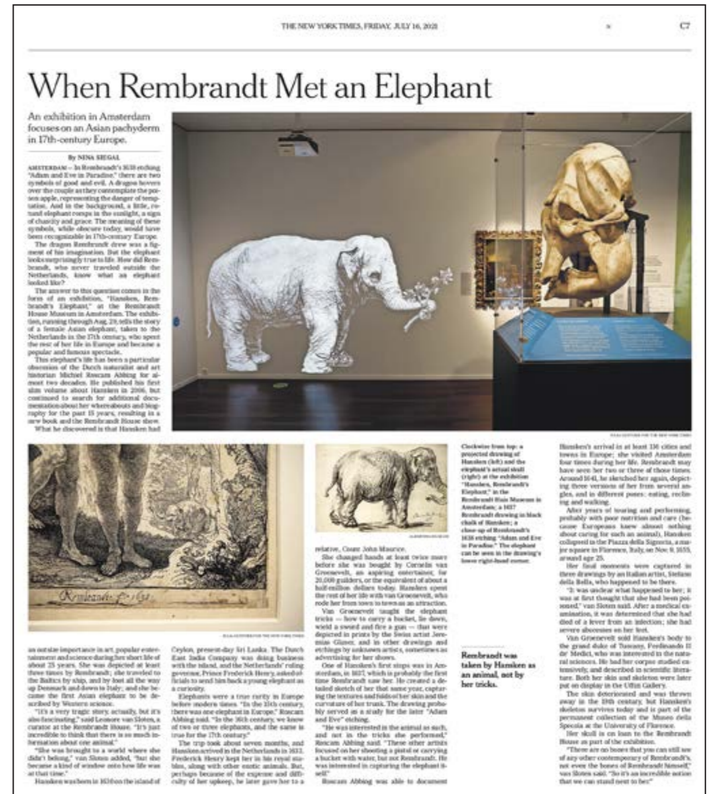
HANSKEN, REMBRANDT'S OLIFANT IN THE NEW YORK TIMES