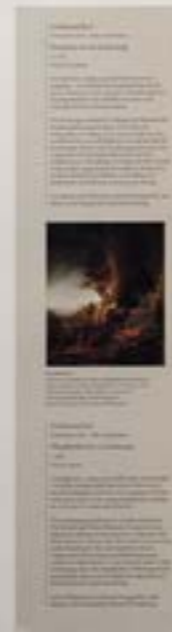
FERDINAND BOL IN DE SAEL.