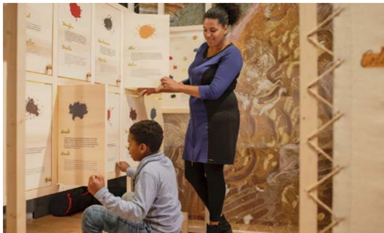
TENTOONSTELLING HALLO REMBRANDT!

De tentoonstelling Hallo Rembrandt! was eind 2020 ook al opgebouwd, maar het museum moest direct na realisatie hiervan sluiten vanwege de lockdown; daarom is besloten deze interactieve tentoonstelling in 2021 nogmaals op te bouwen. Vanaf 17 september konden kleine ontdekkers van 3 tot 12 jaar op speelse wijze Rembrandt en Rembrandts werkwijze leren kennen. Onderdeel van de tentoonstelling in ons museum, was de fotoserie Hoed op voor Rembrandt . Dit kunsteducatieproject van onze partner Stichting Kunsteducatie de Rode Loper op School toont basisschoolleerlingen uit Amsterdam Oost, Berlijn Ost, en London East die zichzelf geportretteerd hebben in de geest van Rembrandt. In de tentoonstelling was, naast de foto's door Marije van der Hoeven, ook een video te zien over het kunsteducatieproject.