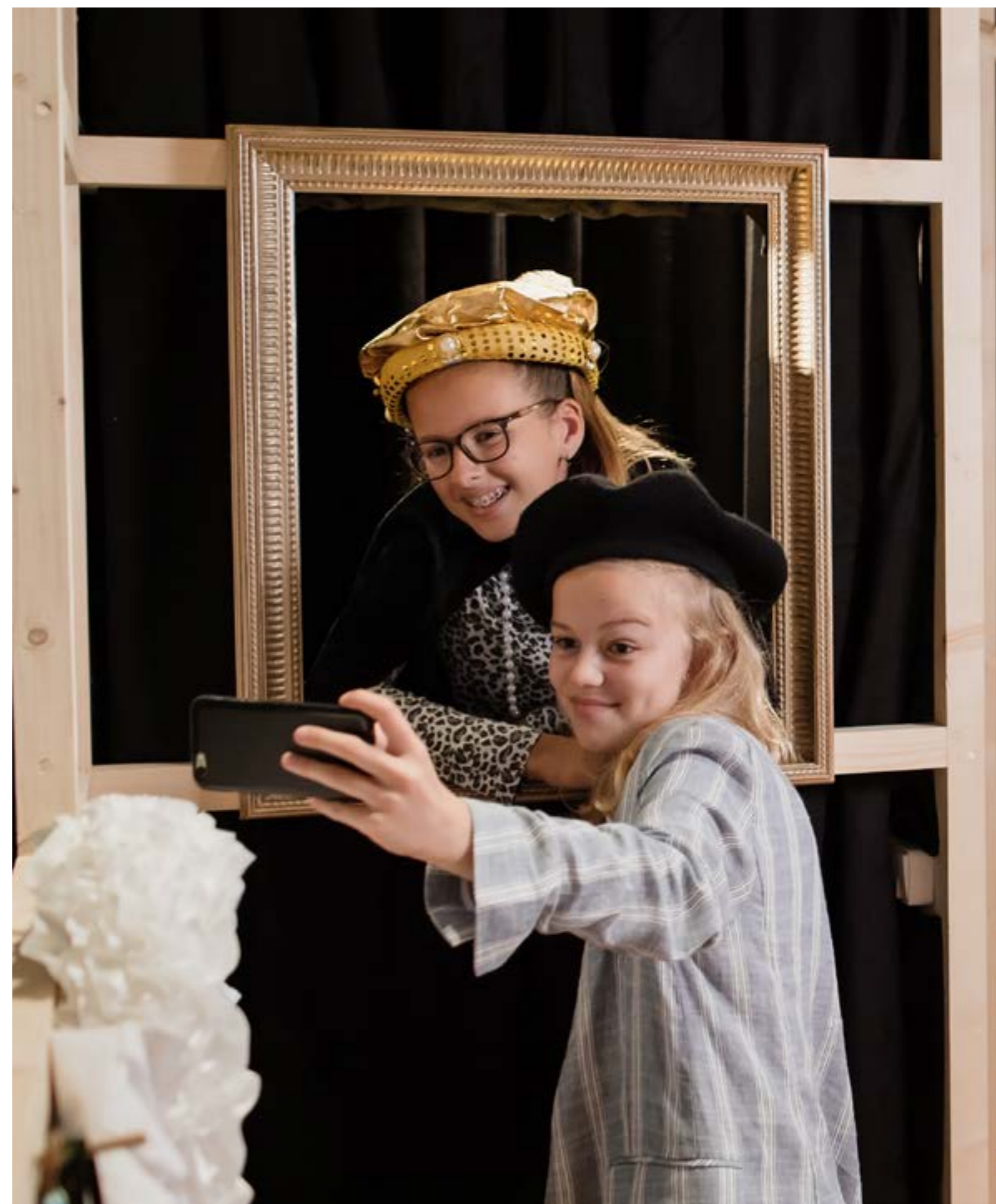
TENTOONSTELLING HALLO REMBRANDT!