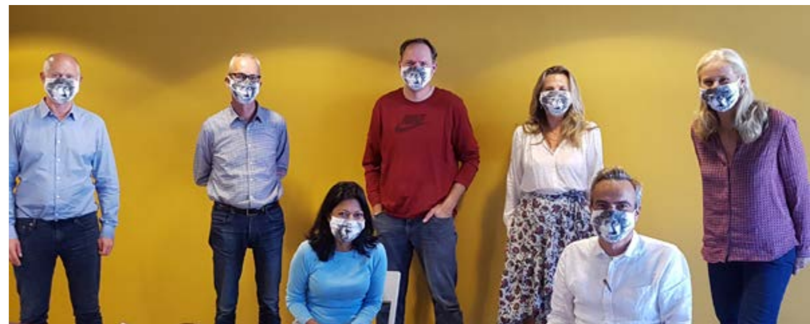
DE RAAD VAN TOEZICHT

UNESCO Centrum NL, penningmeester Bestuur Stichting Cees Goekoop Fonds, lid Raad van Toezicht Stichting Educatie en Cultuur (SEC), bestuurs- lid Stichting Jan Pietersz. Huis, lid Raad van Toezicht Museum Van Loon, bestuurslid Jacoba van Wassenauer Fonds, penningmeester Bestuur Stichting Internationaal van Wassenauer Concours, bestuurslid Stichting Fonds Nederlandse Adel