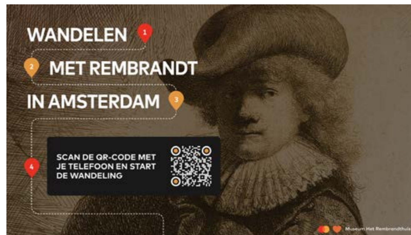
WANDELEN MET REMBRANDT IN SAMENWERKING MET MASTERCARD