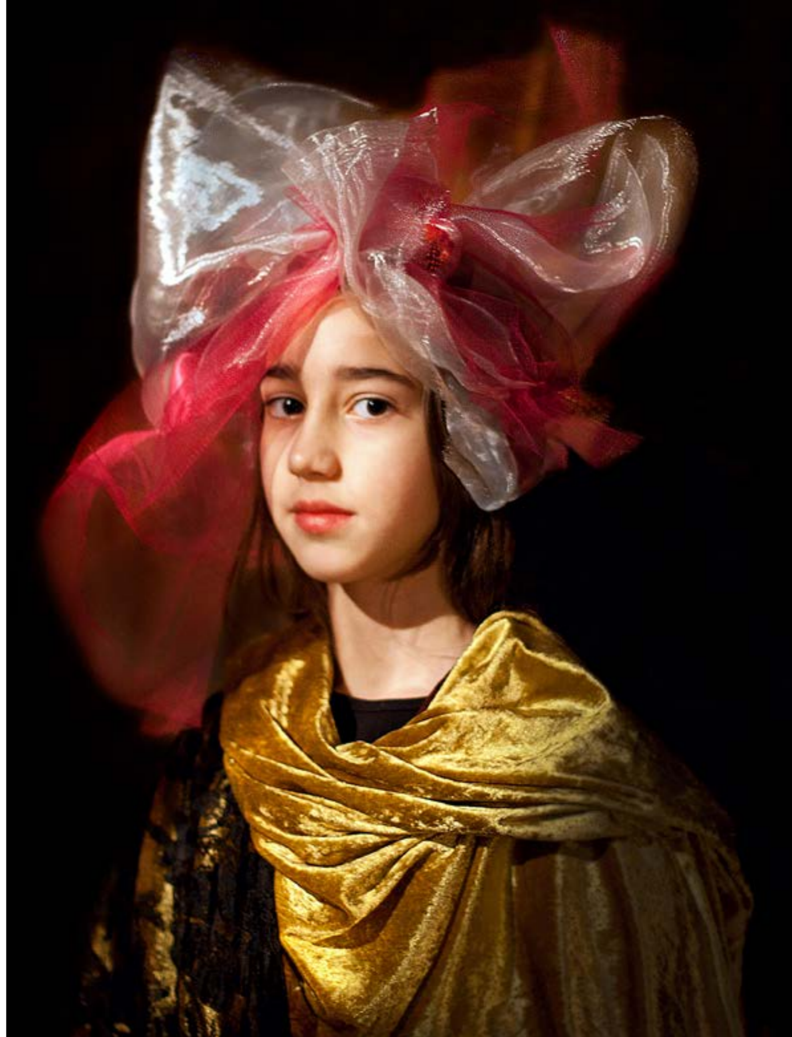
HOED OP VOOR REMBRANDT.