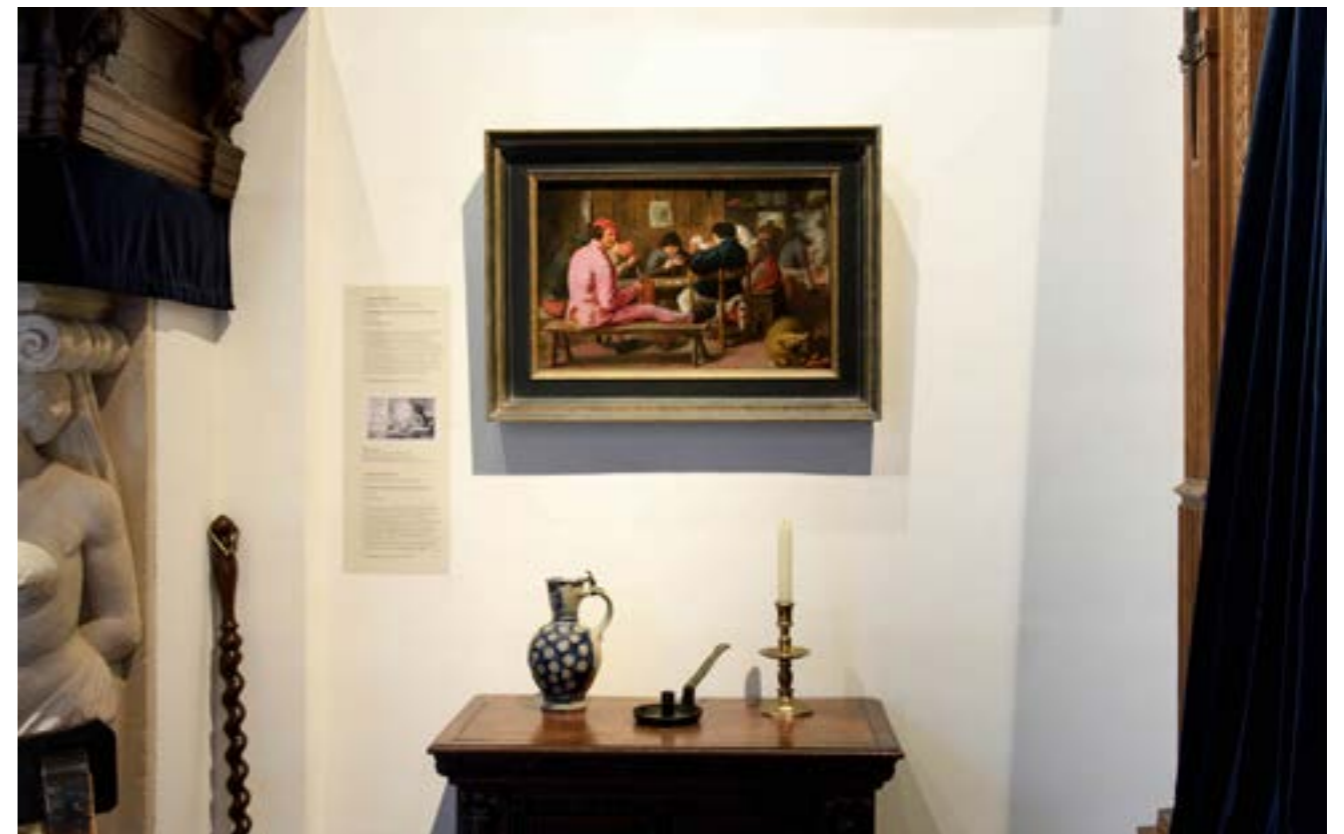
ADRIAEN BROUWER IN DE SAEL.