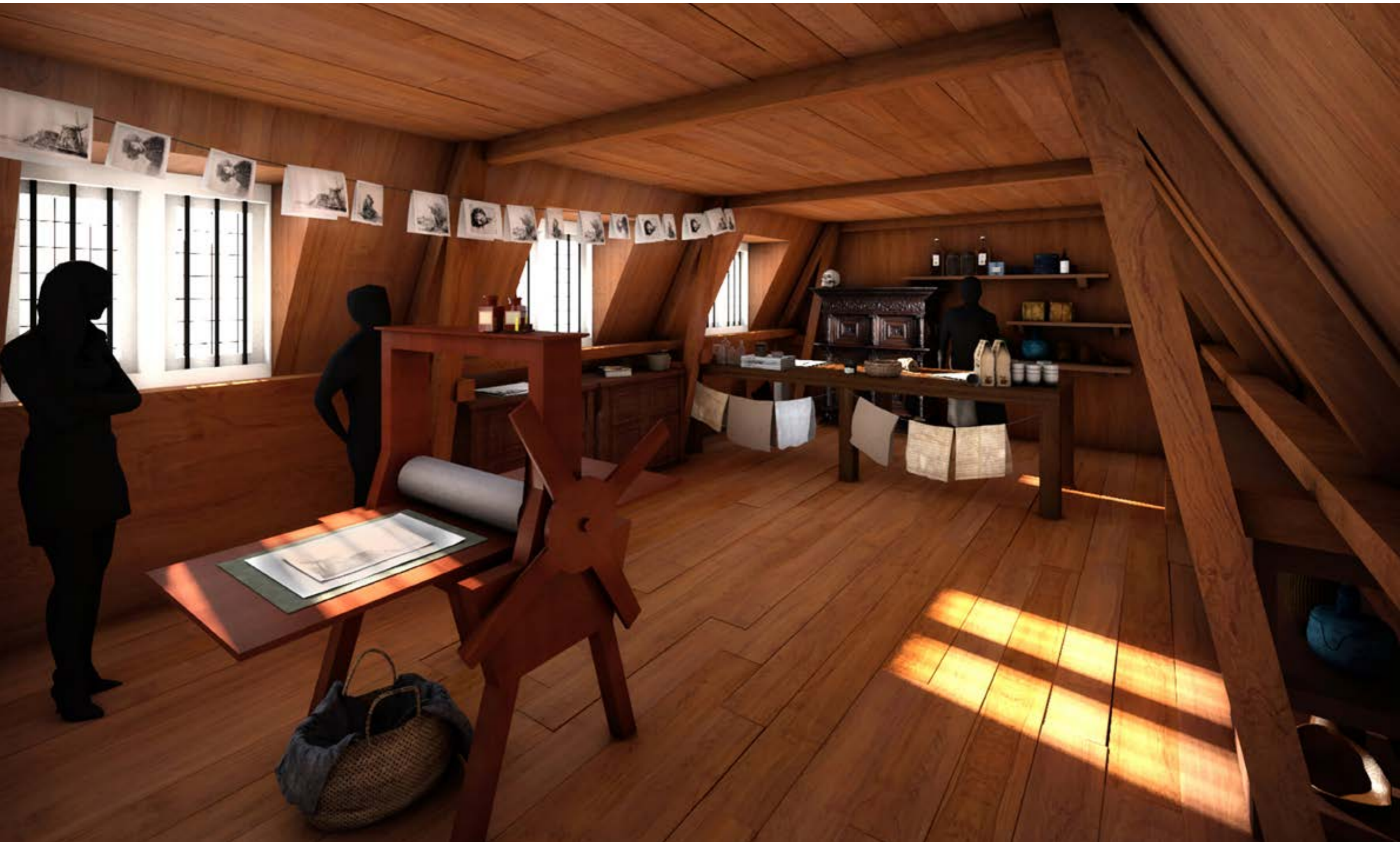
DE NIEUWE ETSZOLDER, ONDERDEEL VAN HET MEESTERPLAN. RENDERING: LIES WILLERS