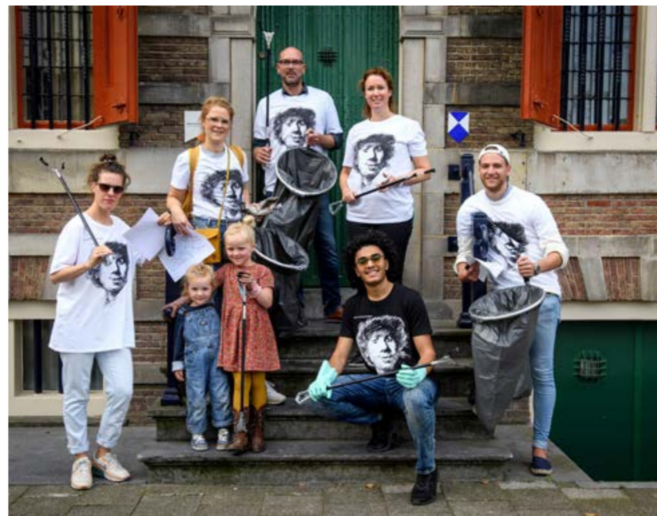
WORLD CLEANUP DAY