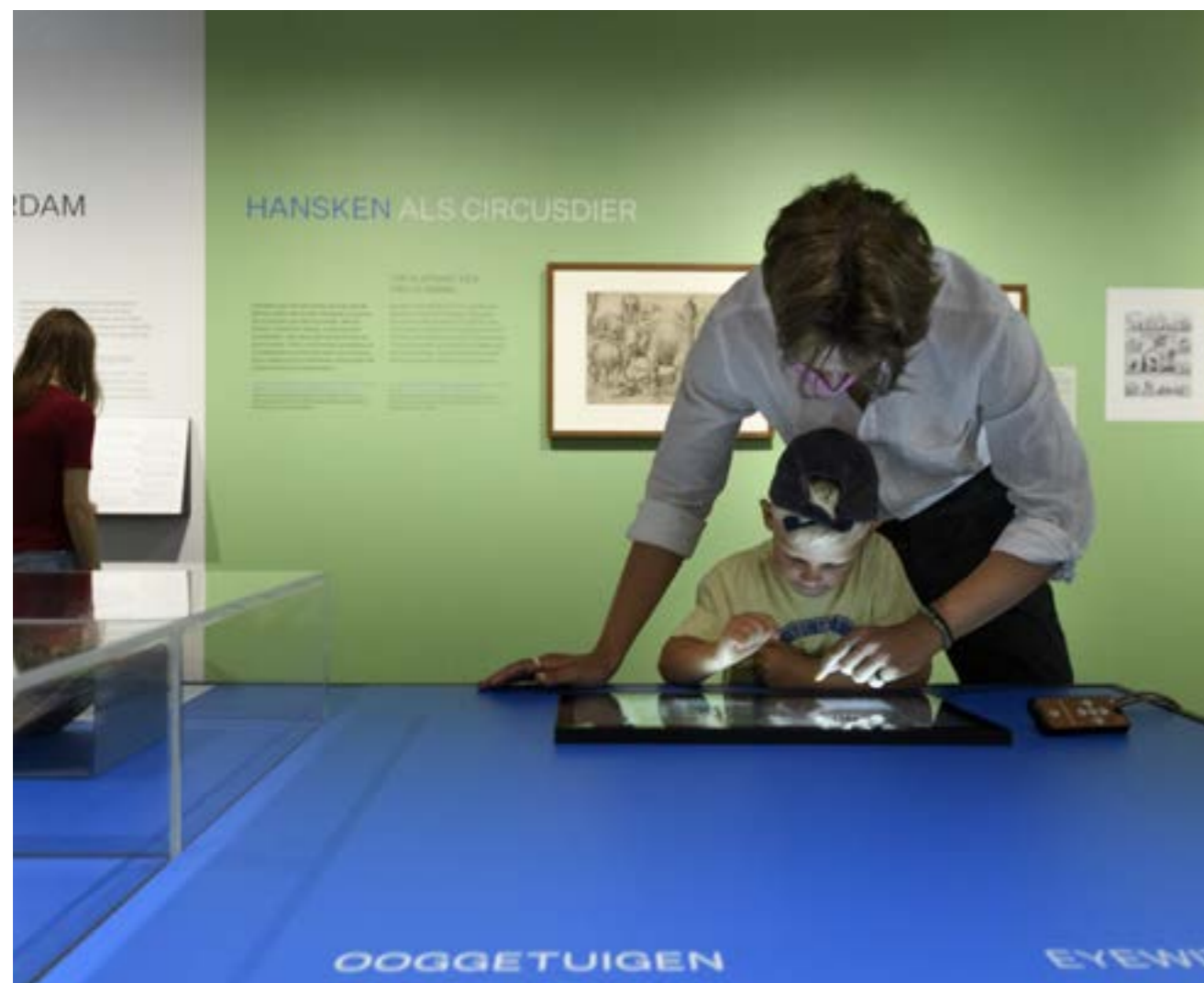
TENTOONSTELLING HANSKEN, REMBRANDTS OLIFANT.

Dankzij een subsidie van het Mondriaanfonds kon per 1 november 2021 een nieuwe medewerker Outreach en Inclusie aangenomen worden, voor drie dagen in de week en met een maximale duur van twee jaar. Zij zal de komende 2 jaar in samenwerking met de rest van het team een Outreach-programma ontwikkelen zodat het museum ook buiten zijn deuren publiek kan bereiken.