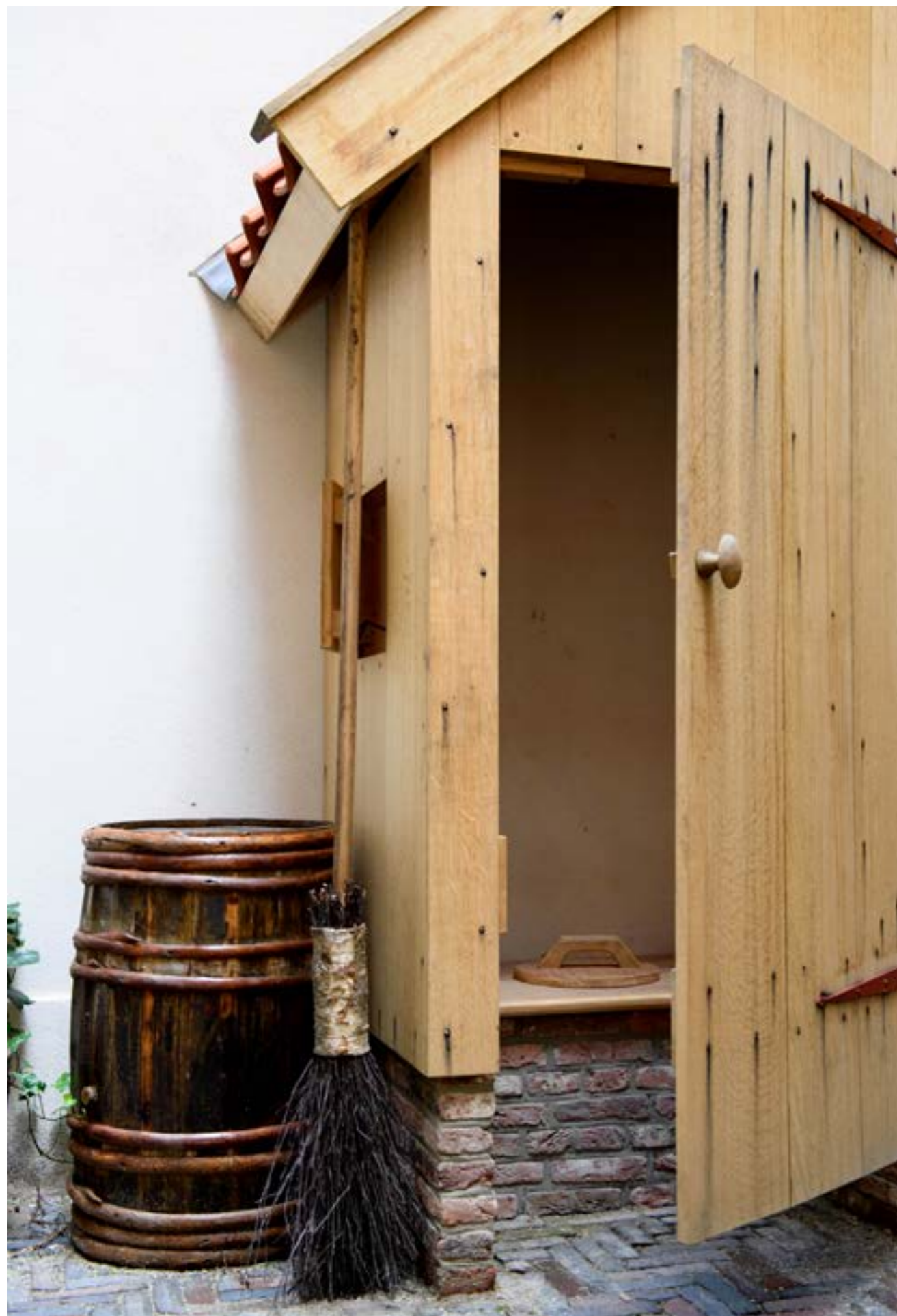
DE GERESTAUREERDE BINNENPLAATS.