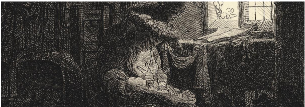
Detail uit: Ferdinand Bol, De Heilige Familie in een woonvertrek , 1643, Museum Het Rembrandthuis, Amsterdam.

De tentoonstelling Inspired by Rembrandt. 100 jaar verzamelen door het Rembrandthuis is van 7 juni tot en met 1 september 2019 te zien in Museum Het Rembrandthuis.