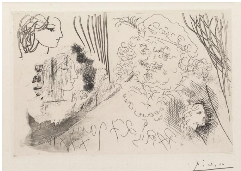
Links: Glenn Brown, Half-Life (naar Rembrandt) 2 , Museum Het Rembrandthuis | Rechts: Pablo Picasso, Rembrandt en drie vrouwenhoofden, 1934 , Museum Het Rembrandthuis, Amsterdam