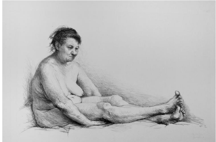
Rechts: Rembrandt, Naakte vrouw, zittend op een heuveltje , ca. 1631, ets, staat II(2), 177 x 160 mm., Museum Het Rembrandthuis, Amsterdam. | Links: Aat Veldhoen, Mevrouw Vlek , 1964. Museum Het Rembrandthuis, Amsterdam