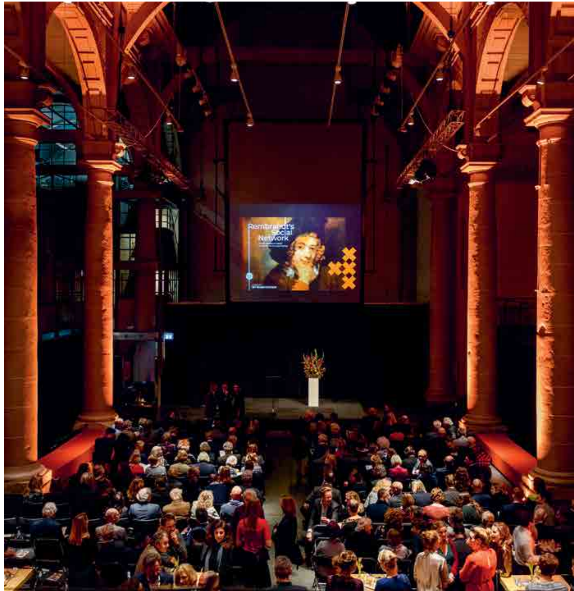
OPENING REMBRANDT'S SOCIAL NETWORK.

Voor het Rembrandtjaar 2019 is intensief samengewerkt met het Rijksmuseum, het Mauritshuis, Museum de Lakenhal, het Fries Museum, het Stadsarchief Amsterdam, Amsterdam&partners, NBTC, BankGiro Loterij en tal van instellingen in het land. Voor de opening van het Rembrandtjaar in 2019 is nauw samengewerkt met de NOS (middels een live uitzending van ons openingsfeest in de straat en in het museum op zaterdagavond) en de Academie voor Theater en Dans die tegenover het museum is gevestigd. Vanaf 2019 zijn we ook een samenwerking aangegaan binnen het landelijke programma Musea bekennen kleur , een verband van 13 musea dat op verschillende niveaus van de organisaties in actie komt voor meer diversiteit en inclusie.