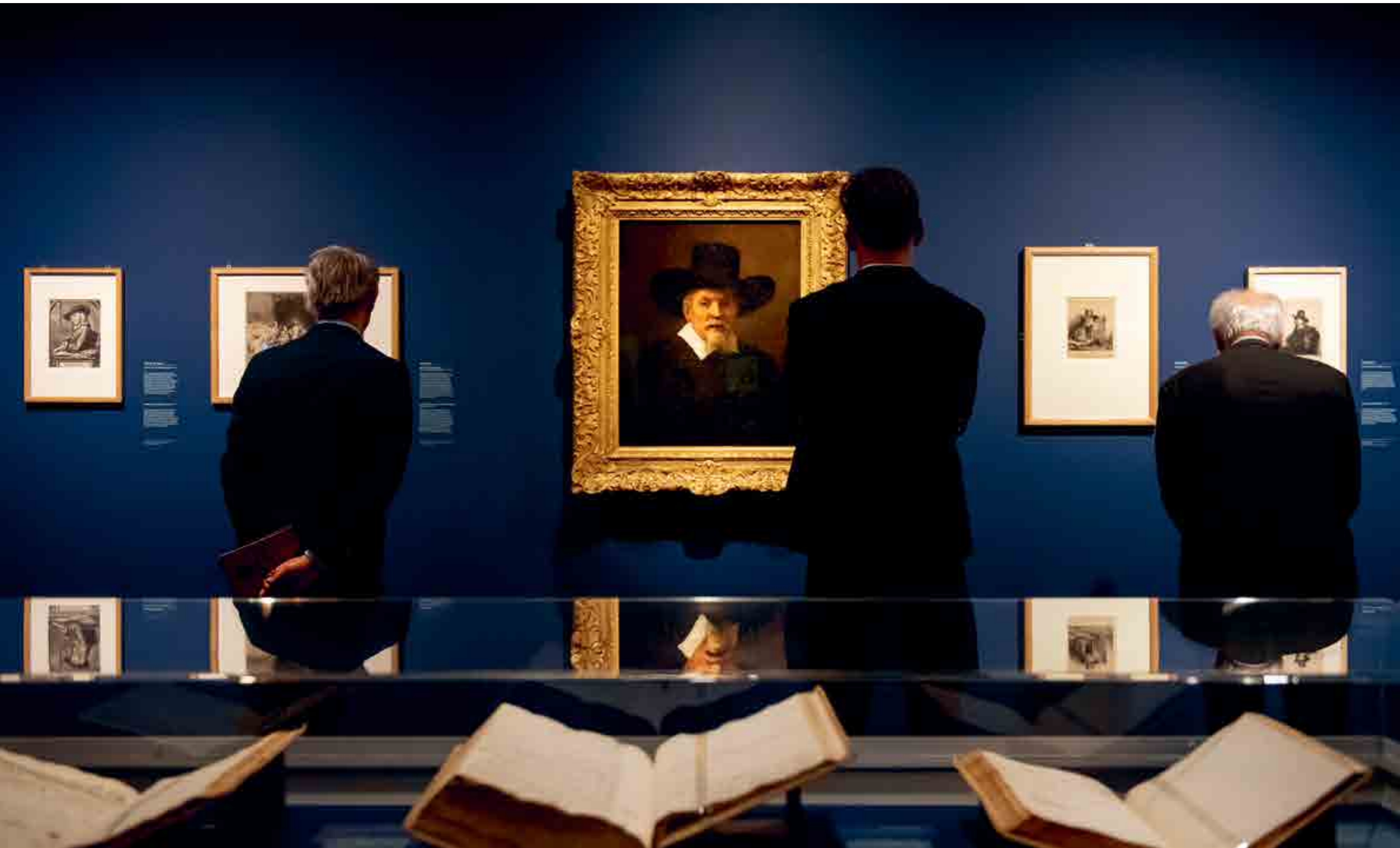
REMBRANDT'S SOCIAL NETWORK. FOTO: MIKE BINK