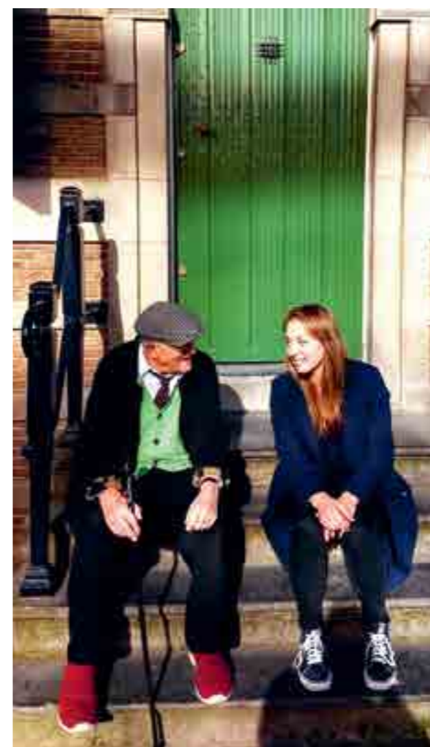
DAVID HOCKNEY VOOR HET REMBRANDTHUIS.