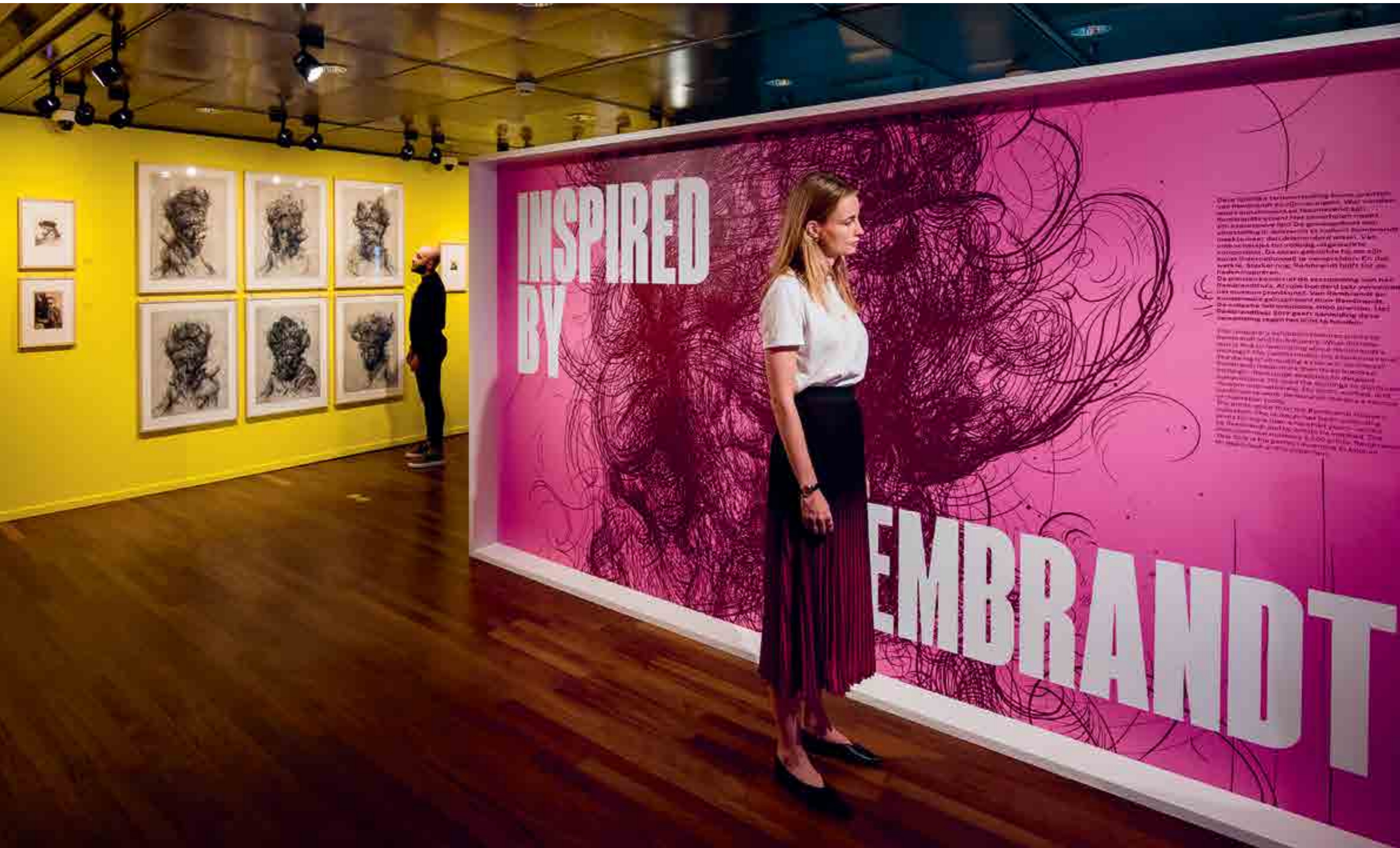
INSPIRED BY REMBRANDT.