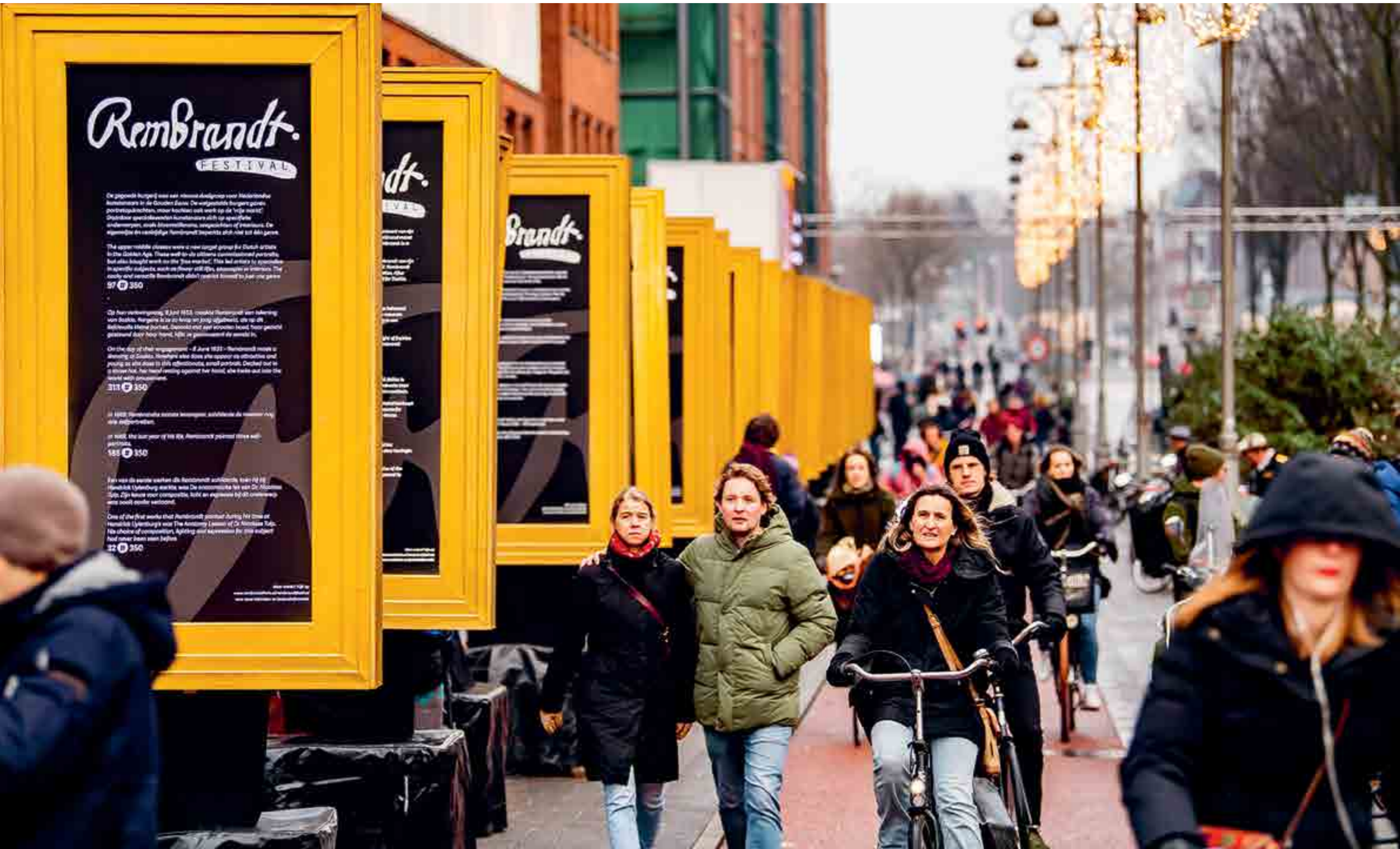
REMBRANDT FESTIVAL.