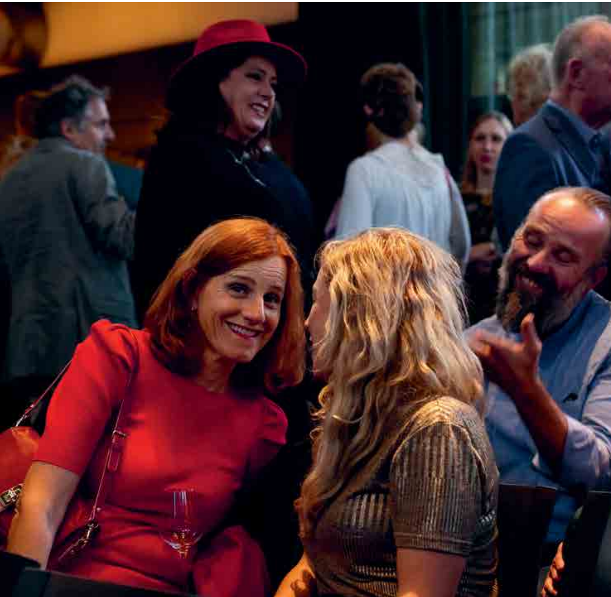
OPENING REMBRANDT'S SOCIAL NETWORK.