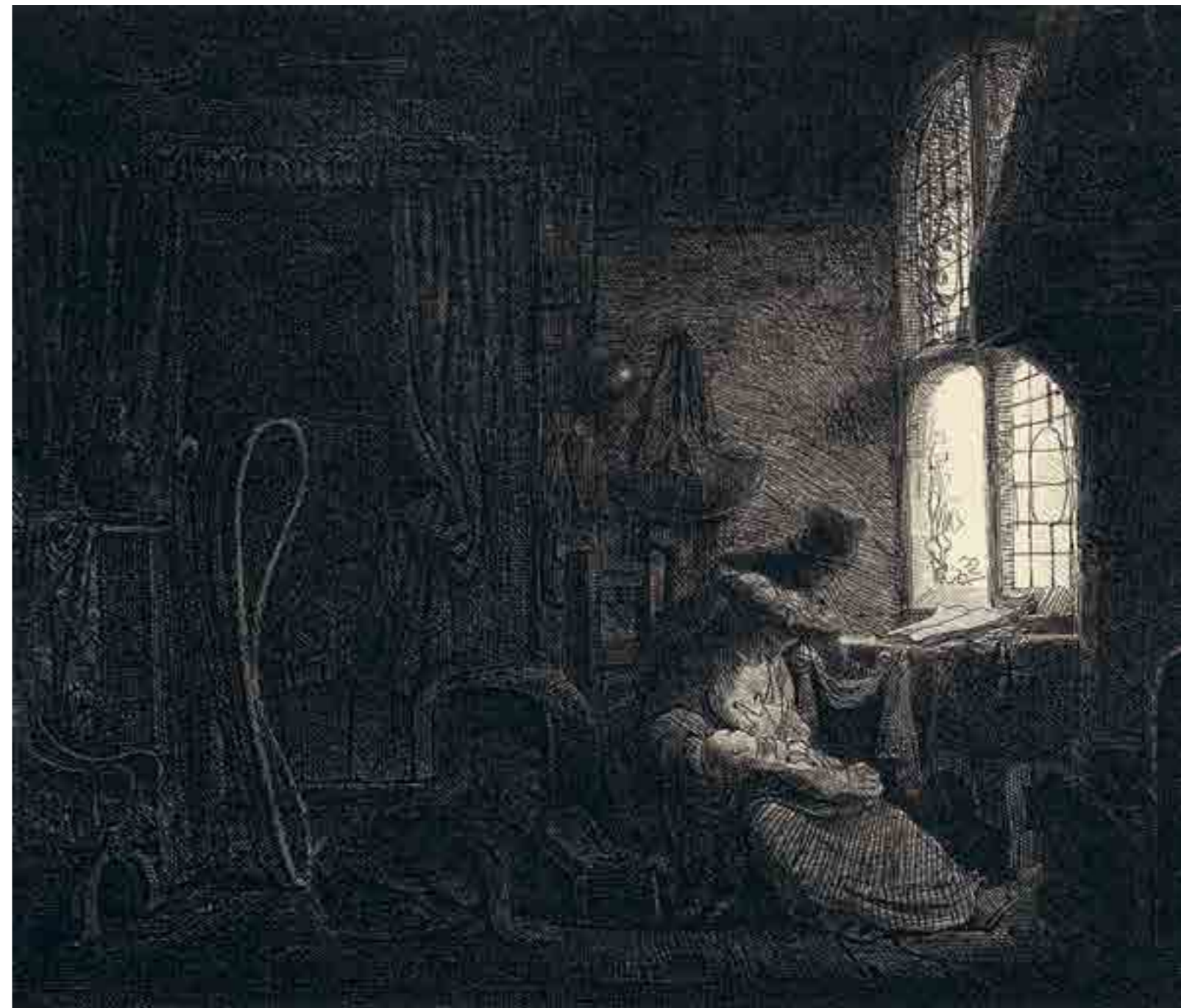
FERDINAND BOL, DE HEILIGE FAMILIE IN EEN WOONVERTREK. 1643

Naast de vele nationale nieuwsuitzendingen over het Rembrandtjaar is het Rembrandthuis in 2019 ook op andere manieren op de Nederlandse televisie geweest. Zo werd de halve finale van het programma Project Rembrandt uitgezonden vanuit het atelier van de meester. Ook maakte in 2019 Museumbende een comeback, waarin presentator Klaas van der Eerden samen met een groepje kinderen het museum gingen testen! Internationaal is het Rembrandthuis ook regelmatig in nieuws-en documentaire programma's verschenen, waaronder in de driedelige BBC-serie Looking for Rembrandt .