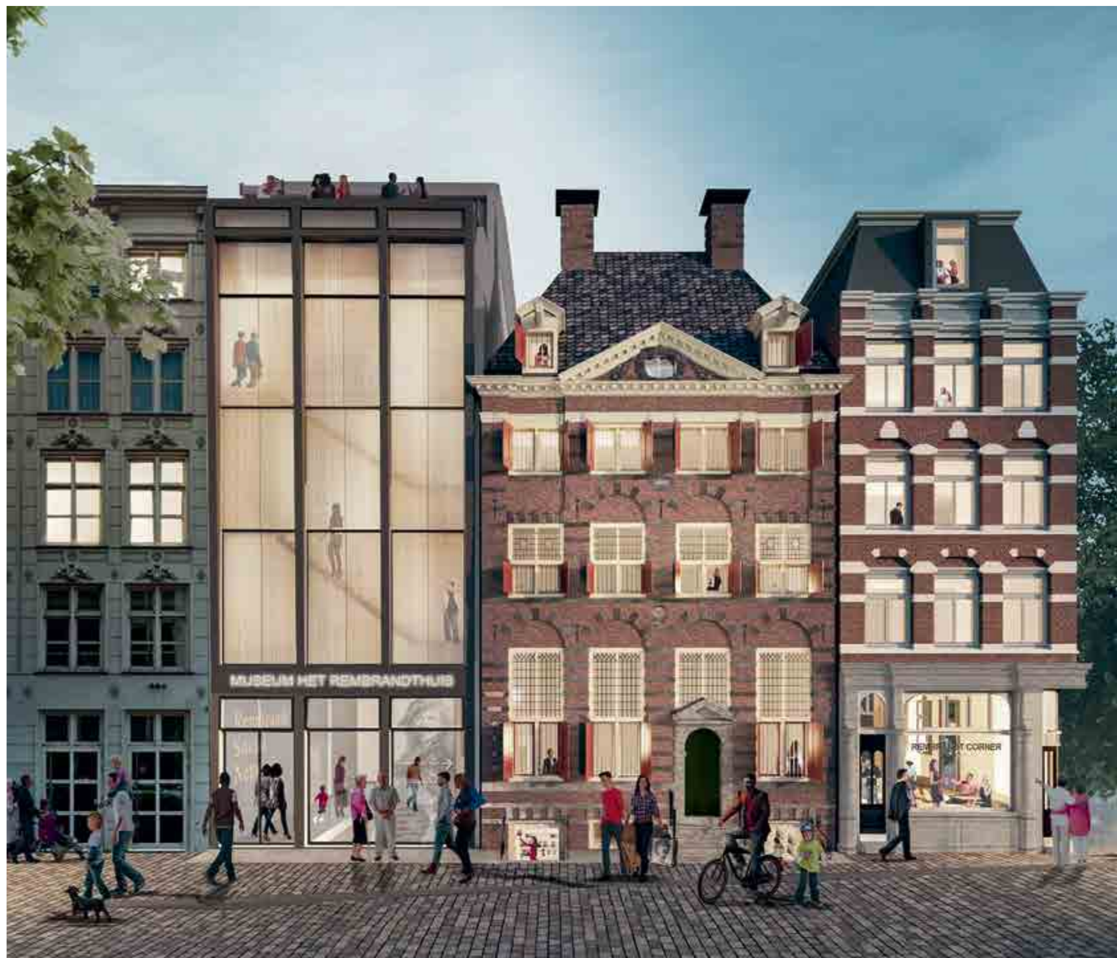
RENDERING MUSEUM HET REMBRANDTHUIS DOOR BIEMANHENKET ARCHITECTEN

bouwtechnisch en bouwfysisch doorgerekend, met speciale aandacht voor verduurzaming van het museumcomplex en de installaties. In de tweede helft van het jaar is veel aandacht uitgegaan naar de financierings-scenario's (o.a. in samenwerking met de gemeente Amsterdam); het ontwikkelen van de capital campaign voor werving van externe middelen; de interne en externe communicatie en het informeren van diverse stakeholders. De bouw- en inrichtingskosten bedragen rond 7 miljoen euro. Afhankelijk van financiering en besluitvorming was de planning om eind 2021/begin 2022 te sluiten voor een periode van een half jaar. Inmiddels is duidelijk dat de coronacrisis stevig ingrijpt, vooral financieel. Dit maakt een aangepaste planning van noodzakelijk, waarbij we inzetten op een gefaseerde uitvoering van de plannen.