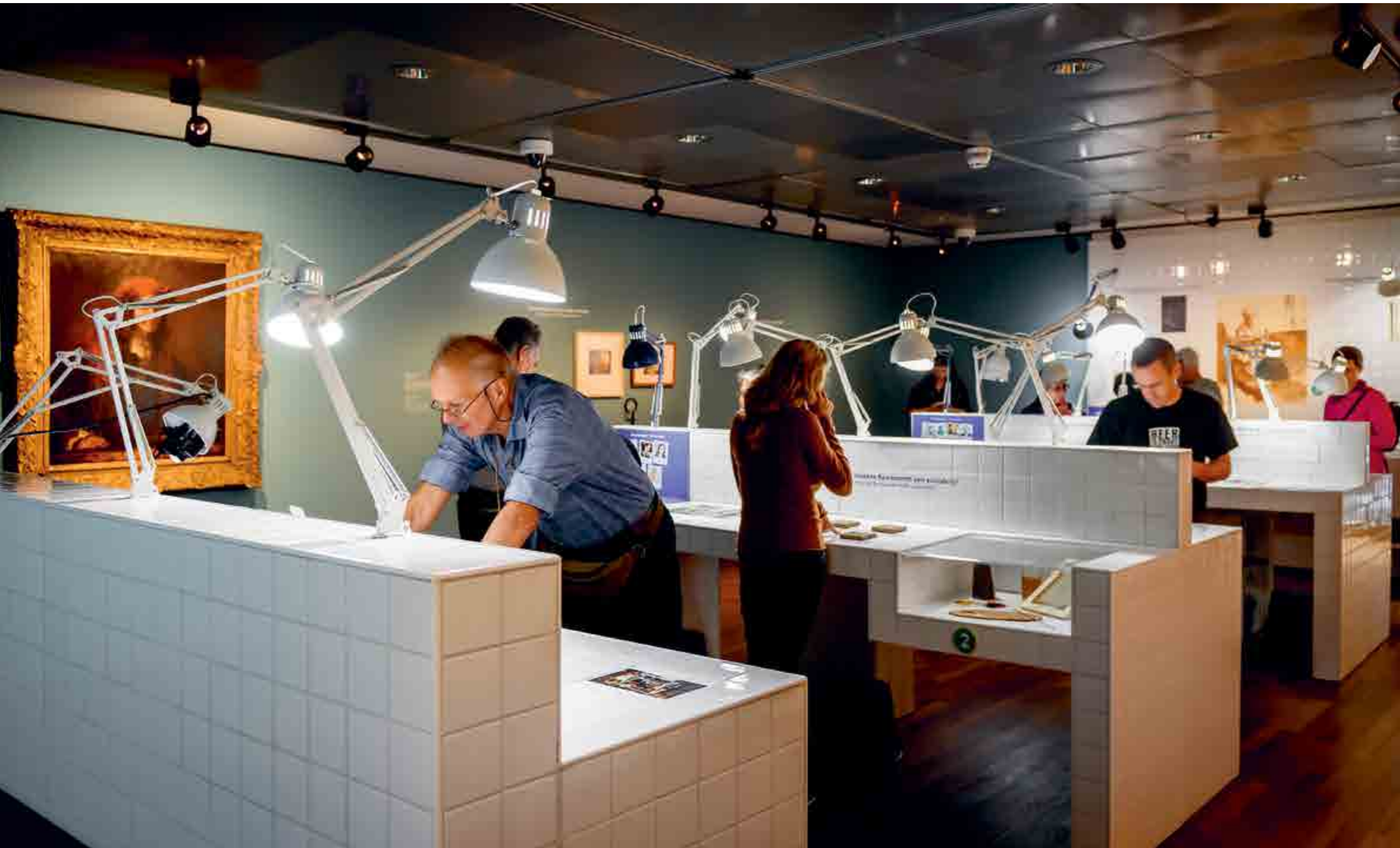
LABORATORIUM REMBRANDT. FOTO: MIKE BINK